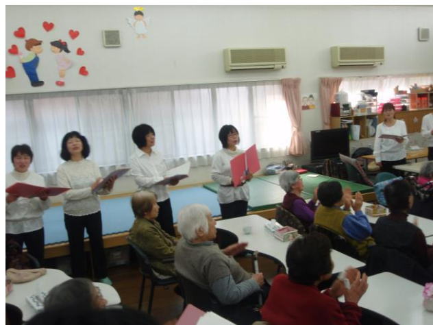
(ボランティア様による催し物風景)